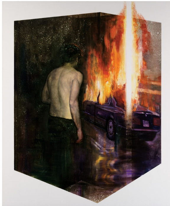
Accident inside the box

A kiállítás a Gallery Weekend Budapest része.