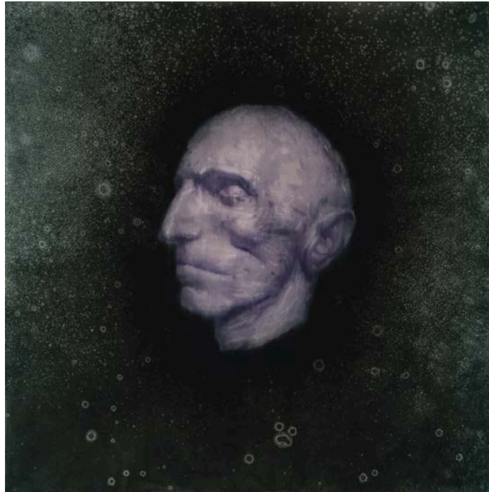
Tesla's death mask

Már csak a kéz maradt ( Inside out box , 2018), nincs arc, elmosódott, elmosta a víz, az idő. A halotti maszk a csend szinonimája ( Tesla's death mask , 2018). Nincs, és mégis jelen van. Létezik az, ami eltűnt. A lélek fizikai jelenléte. Az arc más, a hasonlat. A mágikus gömb, mint varázslat, látjuk benne a jövőt és a jelent ( Inside out room , 2018). Mintha a Holdon lennénk, mintha mesét hallgatnánk vagy néznénk. Mindez a csoda pillanata. Az élet mint csoda, a létezés csodája. Még akkor is, ha van olyan ember, aki nem akarja kinyitni a szemét. Nem akar valamit látni. Lehet, hogy a világot, lehet, hogy önmagát. A csodaszarvas sokágú sarva a képzelet szüleménye is. Odaképzjük, ahol nem volt, ahol nincs. Nyílvesszők ezek, Szent Sebestyén vértanúságának szimbolikus megjelenítése (Juhász Gyula: Szent Sebestyén. ... a seb rózsát terem. )