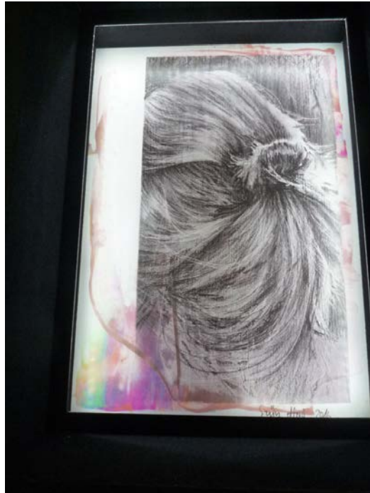
Inside the black box, 2018, részlet, g

Egy varkocs, egy női hajfonat, mint emlék. Nincs arc, csak a dús haj, csak az életerő. Ez az arctalanság a néma beszéd. Néma kiáltás. A bölcs bagoly az ifjú lány fején. Mindent tud, és még nem is élt. Eleget. Egy nyílt arc, mosolygós, szende arc, ártatlan. Ilyen arcot mindenki őriz magában, a gyerekkorából, szülőként, testvérként. Egy csomagot látunk, nem tudni, hogy mi vagy ki van benne.