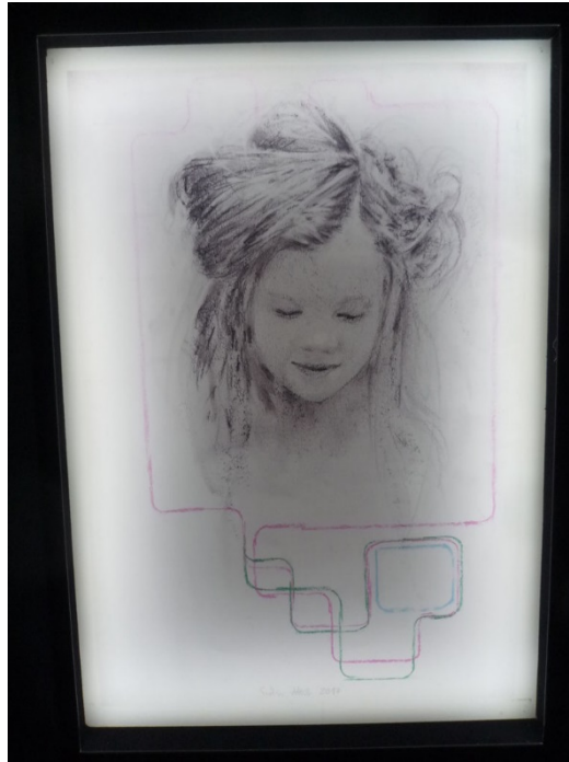
Inside the black box, 2018, részlet, h

Mint a Verdi operájában, a Rigolettóban. Kinyitja ki ezt a zsákot, ezt a csomagot? Előttünk a fal, a szentség fala, áthatolhatatlan, őrtoronnyal. Vigyázzák. Ez nem a Kreml fala, lehetne épp az is, vagy a berlini fal. Ami ledől. Orwell világa tűnik fel előttem egy pillanatra. A bezártság. A sejtés, hogy a sejtyszerű égbolt a szabadság hiányát jelzi. Lehunyt szemű férfi szemére mutat, nem látok. Semmi sem dől össze. Ő lenne a vak jós? Vagy Sámson? Egy pillanatra feltűnik egy rinocérosz, megidézve Dürert (aki maga soha nem látta az állatot), és Orosz Istvánt.