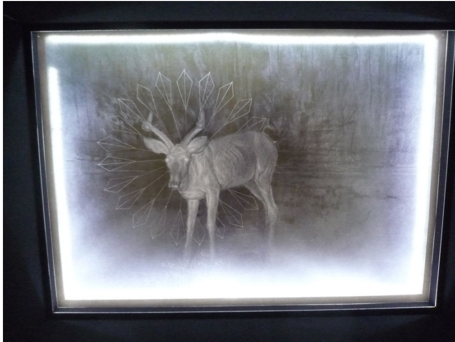
Inside the black box, 2018, részlet,m

Az emlékeket a jelenből és múltból. Kvázi gyöngysort (rózsafüzért) is látunk, felfűzve, mintha imádság közben lennénk, mantrázzuk az igéket. Lelki gyakorlatokat végzünk, recitálunk, kántálunk, mantrák és istenségek nevét ismételtetjük, számolgatjuk. A Jelenések könyvében egy hét pecséttel lezárt könyv szerepel. A pecsétek felnyitásakor egymás után zúdulnak a sorscsapások az emberiségre (Jel 5; 6). A képeket látva a szürkeség az, ami betölti a termet. Ködös szürkeség honol a kocka oldalain. Mintha akaratlanul is Szűcs Attila a hét főbűnt, a hét fő erényt, a hét szentséget járná körbe. Fekete doboza a sorsot szimbolizálja. Nincs jó vagy rossz kimenet. Csak kimenet. Beállunk a sorba, hátunk meggömbül, így maradunk, így haladunk. Ha gyászolunk, akkor is meggörnyed a hátunk. A teher a túlélőé. Neki kell hordania, viselnie. Akár egy álcát. Kezünket feltarthatjuk, szemünk elé fehér kendőt, zsebkendőt tehetünk, vakká válhatunk egy pillanatra, még sincs menekvés.