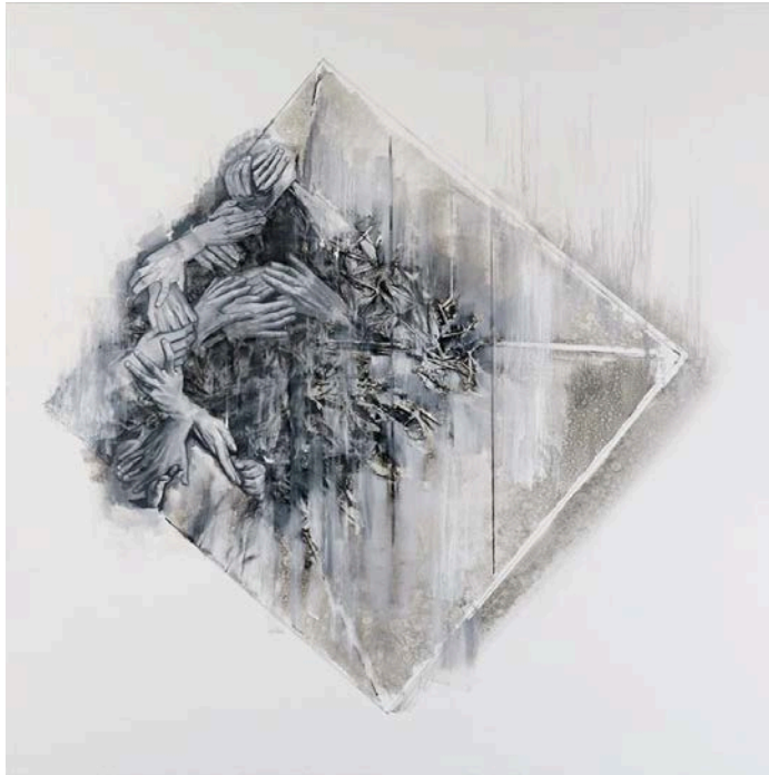
Inside out box

A The book is feladja a leckét, a lapozó kezek kesztyűsek, a fej egy baseballsapka, a figura teste is részben színes könyvhalmaz és ablakkereteket imitáló üresség, nem könnyű olvasni ezt a könyvet, miközben az alak nyitott albumot lapoz.