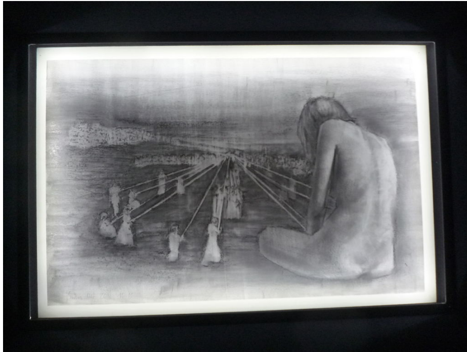
Inside the black box, 2018, részlet, k

Szűcs Attila nem monolitot állít a kiállítótérbe, hanem egy fekete dobozt. A fekete doboz olyan készülék, rendszer vagy tárgy, amely kizárólag csak a bemenete, kimenete és átviteli jellemzői alapján vizsgálható, belső működésének bármilyen ismerete nélkül, azaz megvalósítása „átlátszatlan” (fekete). Szinte bármire lehet hivatkozni fekete dobozként: tranzisztorra, algoritmusra, emberi elmére, művészi alkotásra. A fekete doboznak titka van.