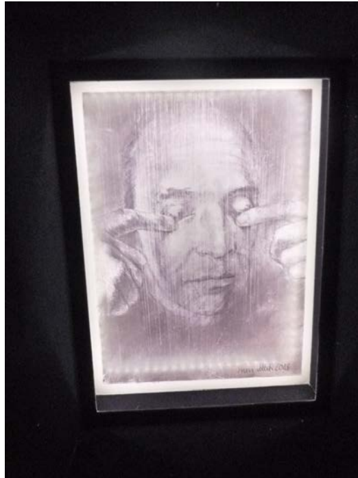
Inside the black box, 2018, részlet, i

Az agancsos állat is jel, piktogram. A fekete doboz alsó és felső részét nem látjuk, nincs róla semmi információ. Szívesen megpördítenénk, vajon mit rejt a két oldal. Nem kaszinóban vagyunk, nem kockázhatunk. A kocka látható oldalain eltérő számú képeket látunk. Hét-nyolc. Itt akár véget is érhetne a számmisztikánk, a szürkeség világít, nyomatok, grafikák, megvilágítva, led-box módjára.