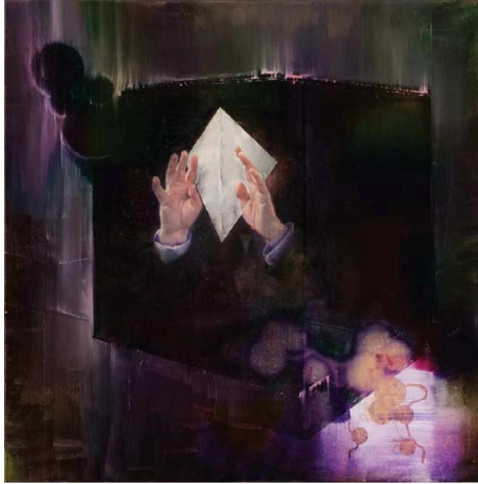
Inside the black box, 2018, részlet, f