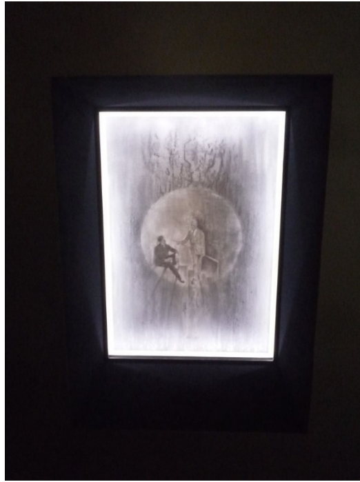
Inside the black box, 2018, részlet, d

Szűcs Attila átláthatóvá és átjárhatóvá teszi az emlékeket, az emlékezés tárgyait, megvilágítja őket. A LED-fénynek így lesz jelentősége. ... álmunk alján lakik / a szellőzőbből bűgő, hajnalig szálló / madár... – írja Tóth Krisztina Porhó című verskötetében. Szűcs Attila a kint is, a bent is ellentétpárját felhasználva hatol az emlékezés, az álmok, az észlelés, a külvilág mélységére. Körkörös alagút, szem-száj nélküli ház. / Honnan is kezdjem el. Tudnád folytatni onnan? – válik A Minotauros z álma című vers külső, a szörnyet őrző labirintusa álmi, belső tájjá. Szűcs Attila fekete doboza is egyfajta belső táj, amit be kell járnunk ahhoz, hogy a láthatatlan szörnyet, kétségünket, bizonytalanságunkat felismerjük, megismerjük, elfogadjuk. Bedobozolva.