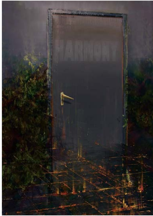
Backdoor to harmony