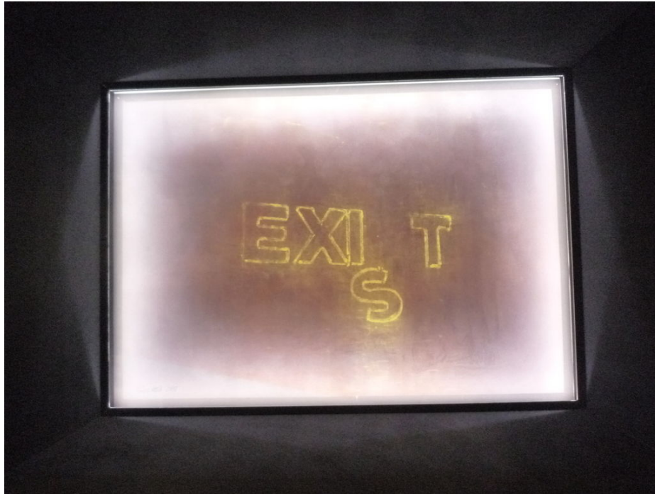
Inside the black box, 2018, részlet, a

Járunk körbe-körbe, és szeretnénk tudni, mit rejt a fekete doboz. Fénylenek kis ablakai, szeme van a doboznak, minden oldalra, mint a póknak. A Deák Galéria készített egy pár másodperces videót, amelyen az látható, hogy a művész a fekete dobozból, egy kicsiny lyukon keresztül a padlón kúszva mászik ki. Fekete lyuk és féregjárat? Már 1935-ben bebizonyította Albert Einstein és Nathan Rosen, hogy a relativitás-elmélet a téridőben „hidakat” (Einstein-Rosen-híd) engedélyez, melyeket ma féregjáratoknak nevezünk. Ilyen féregjáratot egy fekete lyuk tud létrehozni, amely egy másik fekete lyukkal kerül összeköttetésbe, alagútszerű rövidítést hoz létre a világegyetem távol lévő pontjai között. Ez a fekete doboz is híd, összekötő alagút szeretne lenni a nézőhöz?